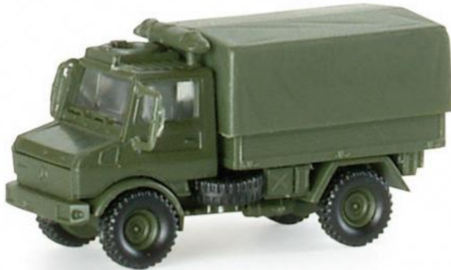
Herpa minitanks #742245 (905)