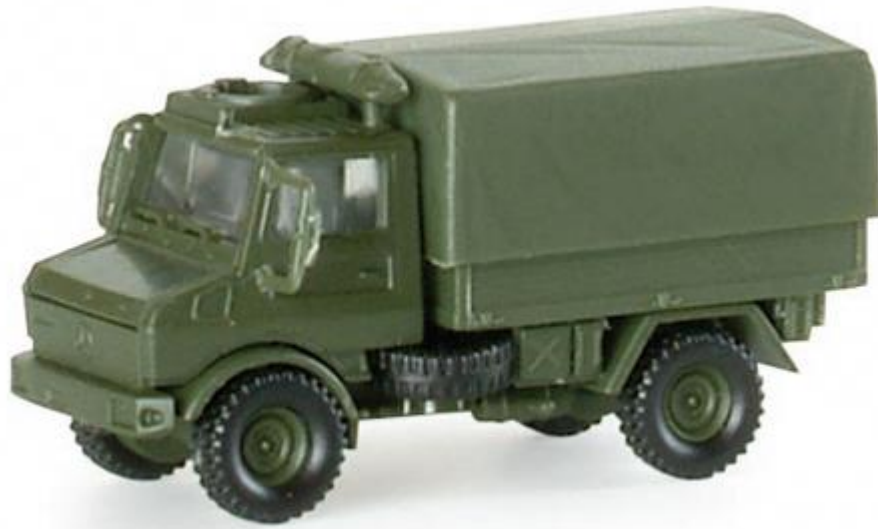
Herpa minitanks #742245 (905)